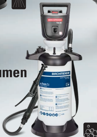
e-Foam 7 E