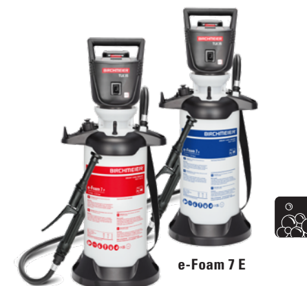
e-Foam 7 P

Der gesamte Tankinhalt kann ohne Unterbruch vollständig entleert werden, was eine grossflächige und zeitsparende Reinigung ermöglicht. Das Gerät mit dem grossen, stabilen Standfuss mit integrierter Schaumrohrhalterung sorgt für sicheren Stand.