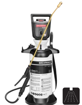
e-Spray 7 P

Der leistungsstarke Akku-Kompressor sorgt für eine konstant hohe Förderleistung, während der grosse, stabile Standfuss mit integrierter Sprührohrhalterung für sicheren Stand und praktisches Handling sorgt – auch unter anspruchsvollen Bedingungen.